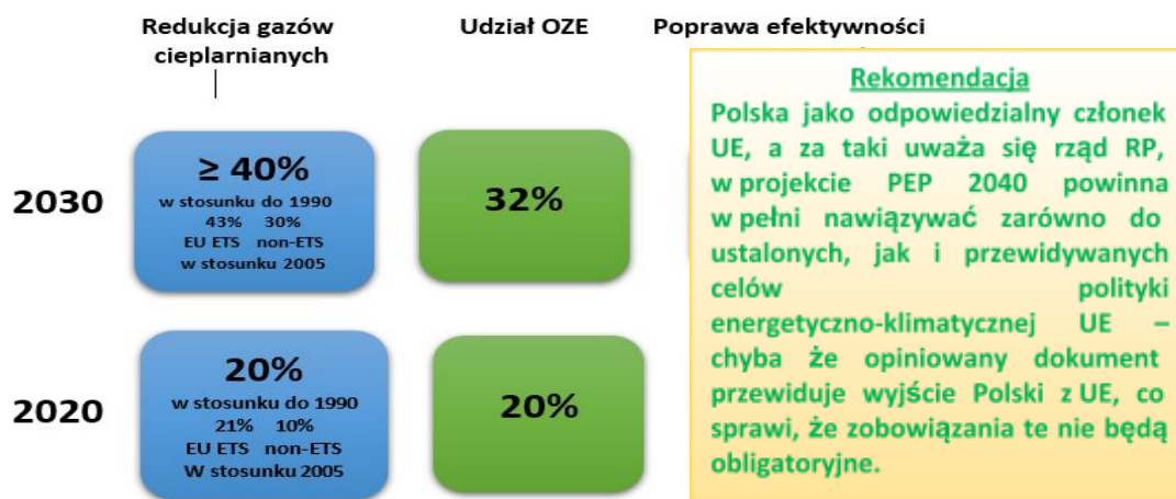
Rys. 1. Cele energetyczno-klimatyczne UE (wykorzystano materiał KOBiZE)

Projekt PEP 2040 wyraźnie odbiega od celów wyznaczonych przez politykę UE. W przypadku roku 2020 w szczególności dotyczy to udziału OZE, który dla Polski został określony na 15% energii finalnej (obecnie jest to 11%). Prognozy pokazują, że – ze względu na politykę dyskryminującą energetykę odnawialną – najprawdopodobniej nie zostanie on osiągnięty. W związku z tym Polska, według szacunków Najwyższej Izby Kontroli za 8 mld zł będzie musiała zakupić od krajów UE posiadających nadwyżki w produkcji energii z OZE brakującą część. Nastąpi wtedy transfer statystyczny, który powoli na wykonanie zobowiązania.